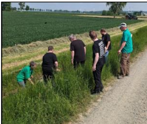
die Suche nach dem Ball war oft schwierig

Am 11.05.2024 war es soweit. Das vierte Crossgolf-Event der Tischtennisabteilung fand bei hochsommerlichen Temperaturen statt. Nachdem das Event durch Corona pausieren musste, bedurfte es etwas Zeit es wieder ins Leben zu rufen und so schwangen die Teilnehmer nach fünf Jahren wieder den Schläger und ließen den Golfball fliegen. Neben ein paar alten Crossgolfveteranen waren auch neue Gesichter dabei und ließen die Veranstaltung eine runde Sache werden. So überraschten immer wieder die Spieler mit teilweise überragenden Abschlüssen im Wechsel mit Weiten im Zentimeterbereich. Auch wenn die zwei Teams gegeneinander spielten und akribisch die Schläge gezählt wurden, war es zum Schluss eher ein gesamter Sieg. Den jeder hatte einen schönen Tag gewonnen und eine nette Zeit gehabt.