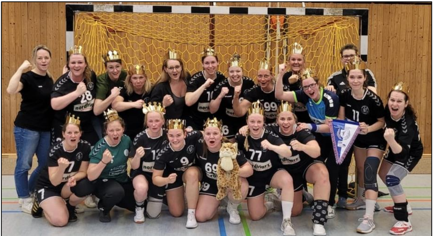
Frauen HSG LiSa 3: Staffelsieger und Aufsteiger in die Regionsoberliga