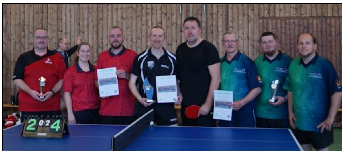
v. l.: MTV Othfresen (in rot, Platz 3), SSV Didderse (in schwarz, Platz 1), STV Ringelheim (Platz 2)