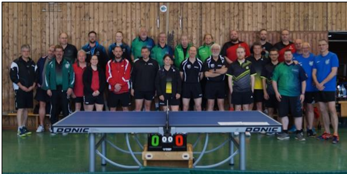
Die Teilnehmer des Turniers