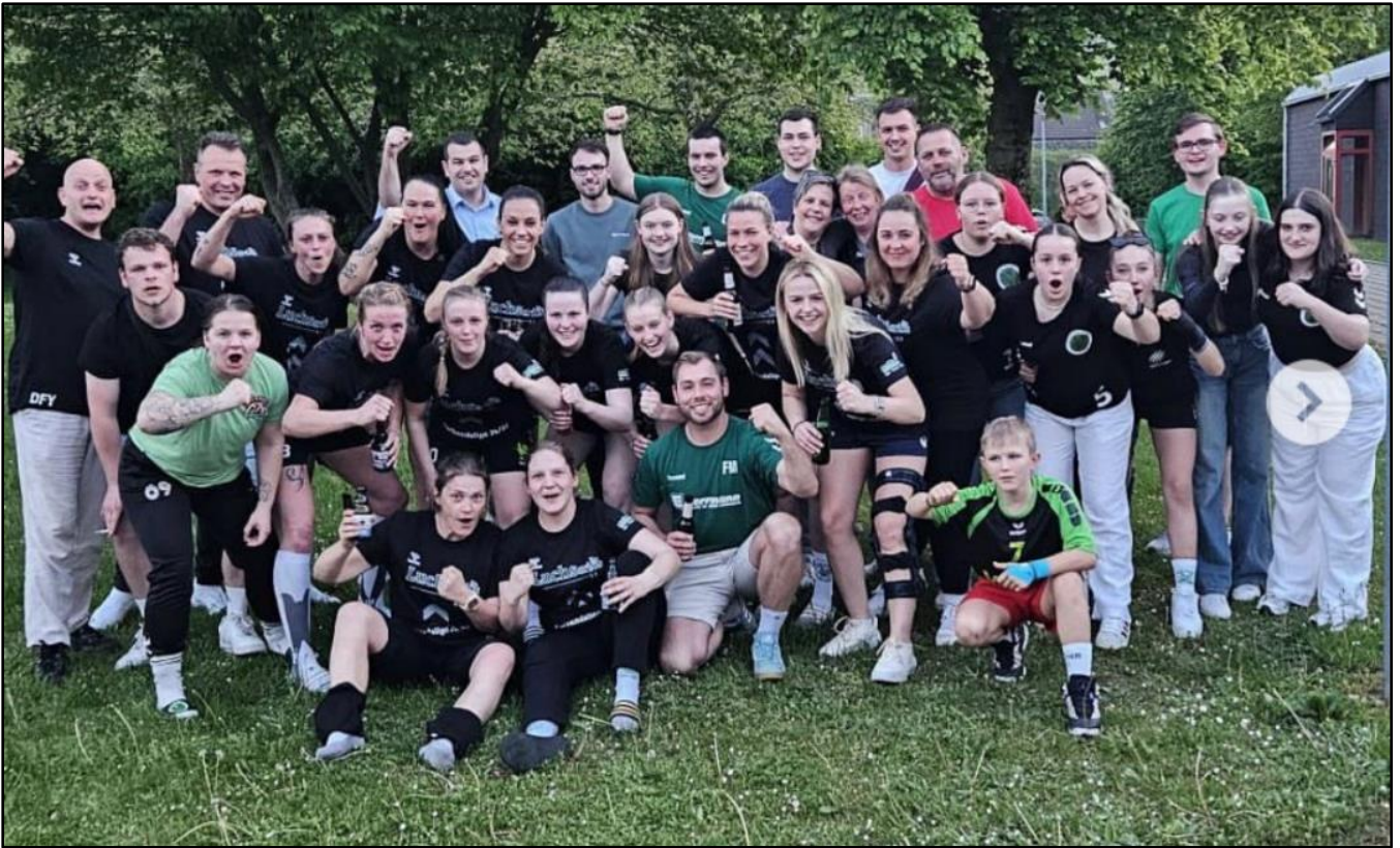
Frauen HSG LiSa 1: Aufstieg geschafft in die Niedersachsen-Verbandsliga