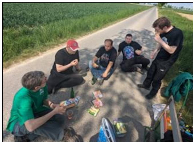
kein abgehobenes Festmahl, sondern ein bodenständiges Frühstück